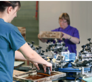
Druck und Design